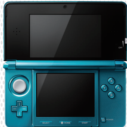
NINTENDO 3DS™ NINTENDO 3DS XL™