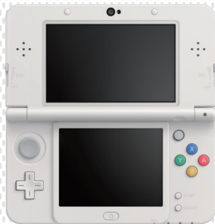
new NINTENDO 3DS™ new NINTENDO 3DS XL™