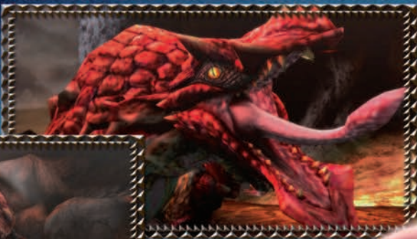
RATHIAN TYPE: FLYING WYVERN DREIGING: ★★☆☆

Vuurspugende vrouwelijke wyverns, ook wel bekend als 'de koninginnen van het land'. Met hun krachtige poten en giftige staartstekels jagen ze voornamelijk op de grond. Rathians leven in harmonie met Rathalos, en het is bekend dat ze soms gezamenlijk jagen.