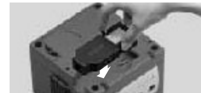
Illustration 2 – Insérez l'adaptateur à bande large.